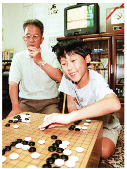
アマチュア高段者の祖父(左)から手ほどきを受けた。平成10年、大阪府東大阪市