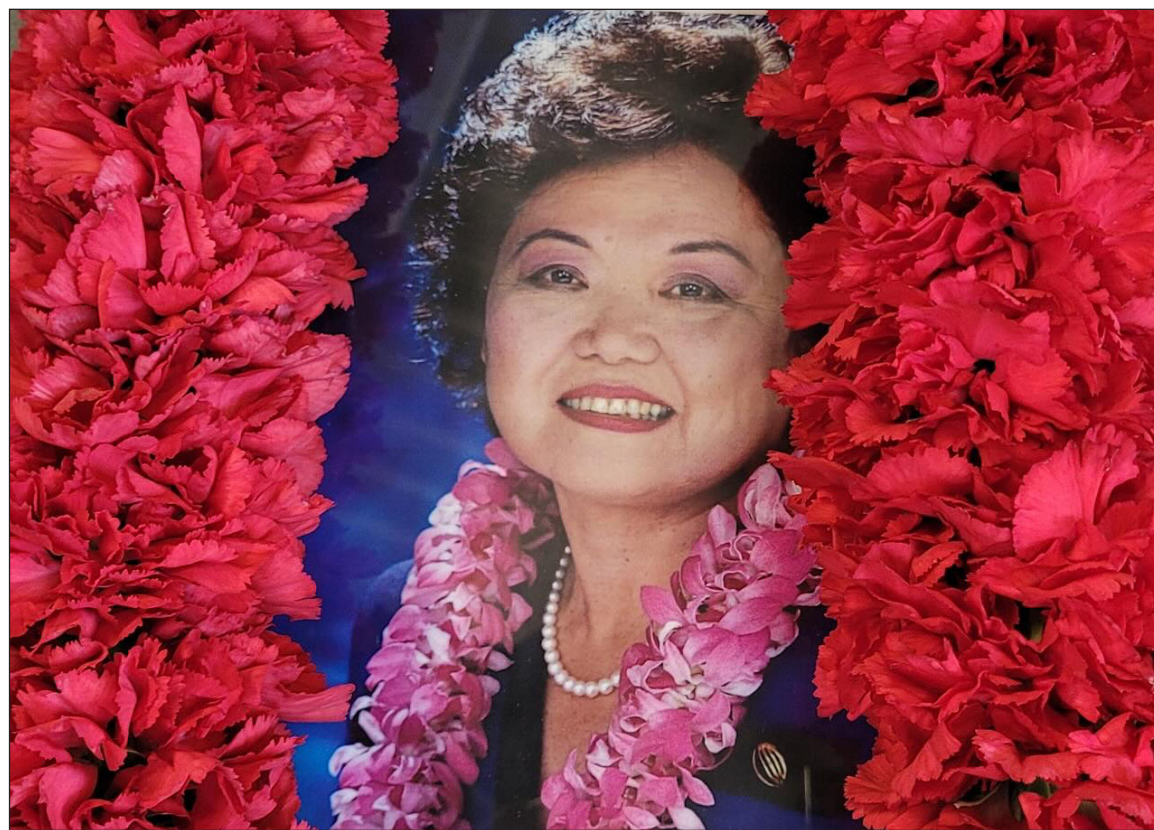
A photo of Rep. Patsy Takemoto Mink when she served in Congress from 1990 to 2002.

DOLLAR UP: The dollar was higher in trading Wednesday on the Tokyo Foreign Exchange Market, finishing at 157.87-88 yen, up 1.01 yen from Tuesday's close.