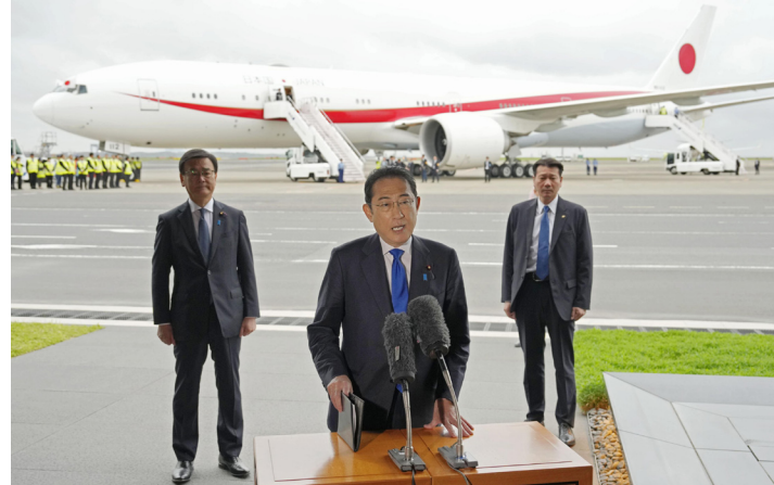
岸田首相は1日、東京の羽田空港でフランスに向け専用機で出発するのを前に記者団に話す

岸田首相は1日、フランスに向け政府専用機で羽田空港を発行し、2日パリで開かれる経済協力開発機構(OECD)関係理事会で演説する。羽田空港で記者団に「ルールに基づく自由で公正な国際経済秩序の構築、強化を主導すると訴えたい」と語った。フランスのマクロン大統領と個別に会談し、南米のブラジルとパラグアイも訪問する。