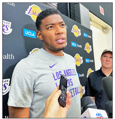
Rui Hachimura had 15 points in the Lakers' season-ending loss.

The Game 5 loss left the Lakers with a 4-1 series defeat in the best-of-seven first round, which started