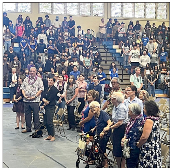
The gathering in Maui High School's Matsui Gym was the only official unveiling of the quarter after the one in Washington, D.C. The school distributed 1,600 quarters to the students.

As one of our most notable alumna, for her outstanding achievements as the first "woman of color" elected to the U.S. Congress, where she worked tirelessly for civil rights, women's rights, economic justice, education equity, civil liberties, peace, and the integrity of the democratic process. Through adversity, she was able to champion legislation that